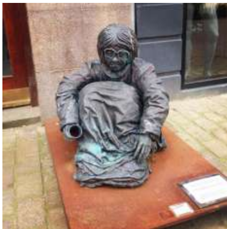
En af de mange statuer af hjemløse som står rundt om i Viborgs gågade ...