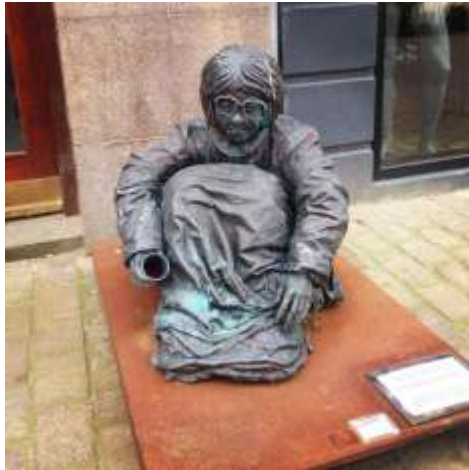
En af de mange statuer af hjemløse som står rundt om i Viborgs gågade ...