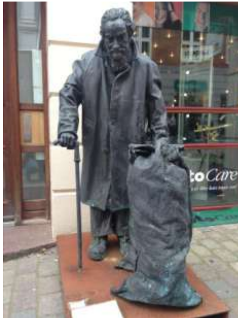
En af de mange statuer af hjemløse som står rundt om i Viborgs gågade ...