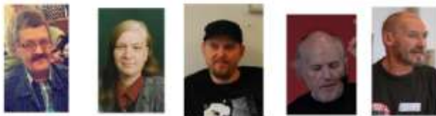
© "BEHANDL OS ORDENTLIGT" - STYREGRUPPEN

Alle rettighederne tilhører © Behandl os ordentligt